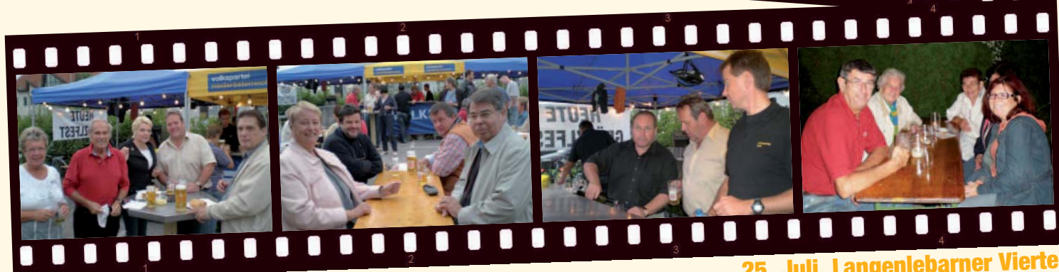
25. Juli, Langenlebarner Viertel