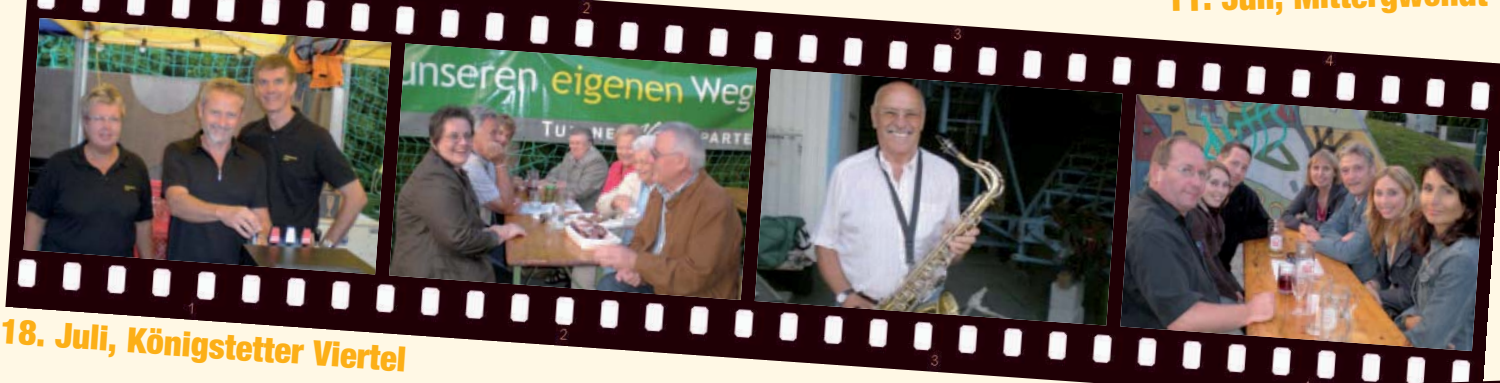
18. Juli, Königstetter Viertel