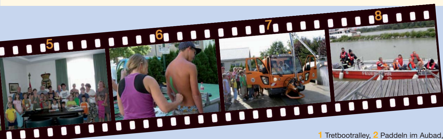
1 Tretbootralley, 2 Paddeln im Aubad, 3 Besuch der Garten Tulln, 4 Eröffnung der Skaterbahn, 5 Entdecke das Radhaus, 6 Bodypainting, 7 Entdecke den Bauhof, 8 Feuerwehr-Aktivitäten Webtipp: Weitere Fotos vom Tullner Aktivsommer im Internet: http://tulln.ferienspiele.at