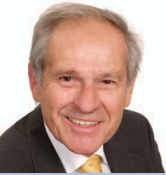
Bürgermeister Willi Stift