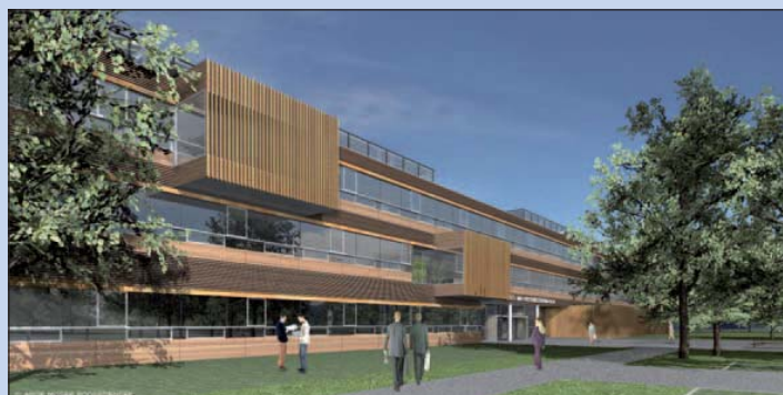
Schon bald Realität: Universitäts- und Forschungszentrum Tulln