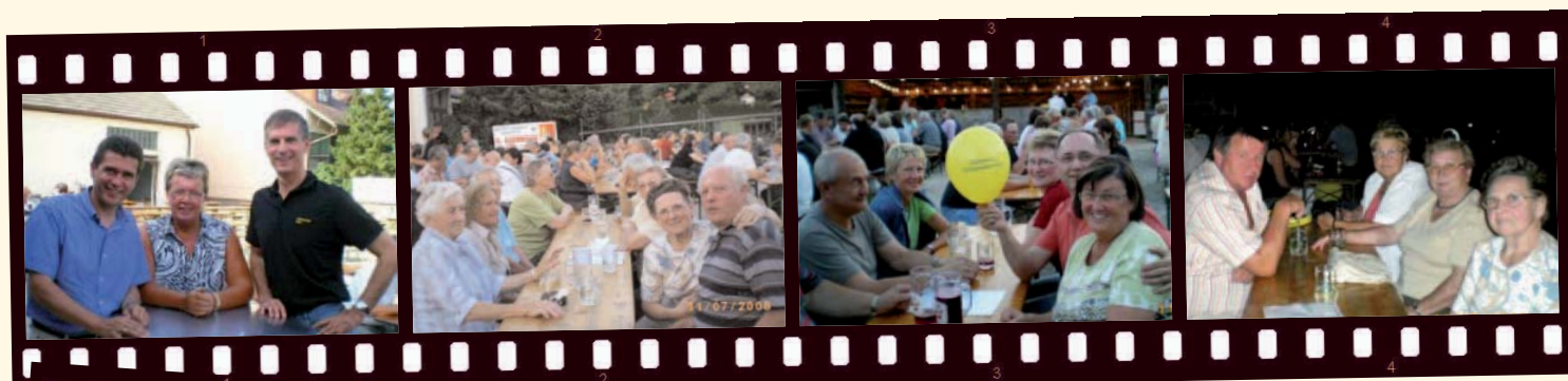
11. Juli, Mittergwendt